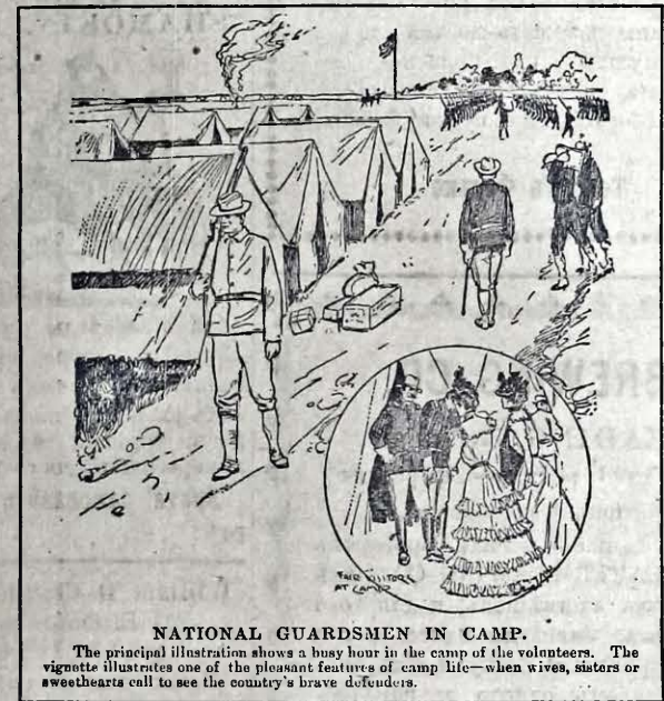
NATIONAL GUARDSMEN IN CAMP. The principal illustration shows a busy hour in the camp of the volunteers. The vignette illustrates one of the pleasant features of camp life—when wives, sisters or sweethearts call to see the country's brave defenders.

О. Песторъ Дмитровъ переносить ся зновъ до Канады, де стало замешкае въ Оттавѣ. Мае вѣнь намѣрь обляджати все рускй колоныи, щобъ переконати ся якъ поступили ты, що вже давно осѣли на фармахъ, а новинамъ, що ино прибувшимъ зъ краю, дати всказовки на будуче. Кто знае, якъ утижливою есть фзда по канадйскыхъ просторахъ, той лишь може позавидувати о. Н. Дмитрову томъ вытрелалости и завягости въ его намѣрахъ.