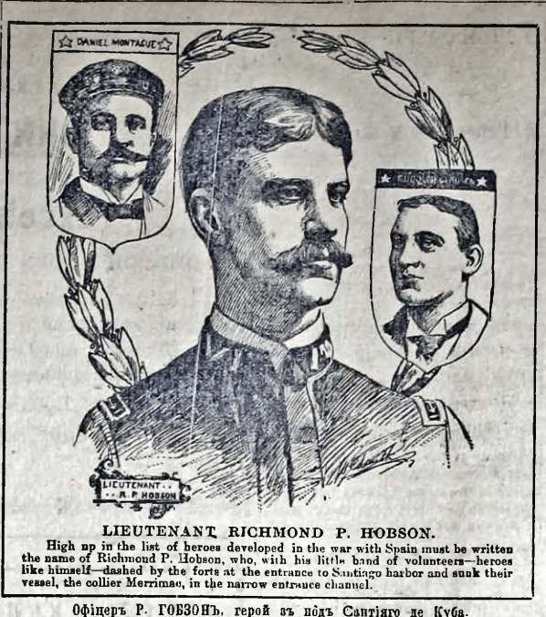
LIEUTENANT RICHMOND P. HOBSON. High up in the list of heroes developed in the war with Spain was written the name of Richmond P. Hobson, who, with his little band of volunteers—heroes like himself—dashed by the forts at the entrance to Santiago harbor and sank their vessel, the Collier Merrimac, in the narrow entrance channel. Офицеръ Р. ГОБЗОНЪ, герой въ водѣ Сантьяго де Куба.