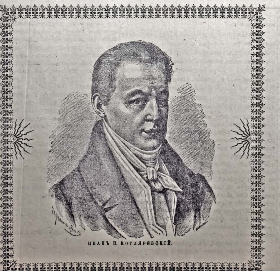
ИВАНЪ П. КОТЛЯРЕВСКІЙ.

Тыми днями читавъ-емъ о одномъ молодѣмъ духоборцѣ, котрого однокого, безъ товаришѣвъ заслано до полку въ Самаркандѣ. Зновѣтй самый вымоги зѣ стороны властей и тй самый поединчи, неопровержимій водповѣди: „Неможу робити того, что жадають.“ (Продовжене на другой сторинѣ).