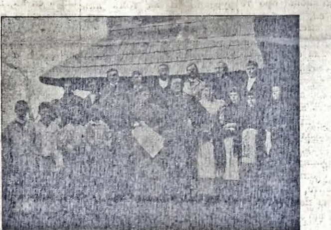
Руска читальня въ Рио Кларо, въ Бразиліи.