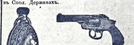
Той „незолочуваний“ 14 каратовый годпникъ, за котрый гарантуемо 20 лѣтъ, зъ правдивымъ „Elgin“ веркомъ вартъ $36.50, револьверъ до лопачи $7.75 и гармоника або скрипка въ цѣлѣ $4.50, мы те все дамо за $11.75 цѣт.