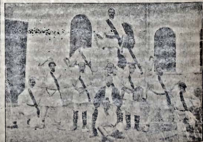
Дѣвѣдниця „Січи“ вь Печенѣжинѣ.

ДЕМОНСТРАЦІЇ вь Хар- ковѣ. На недавнѣмъ засѣ- даню правничого товари- ства при харківскѣмъ уні- верситетѣ, на котрѣмъ було около 500 осібъ зъ інтелі- генції, голова товариства проф. Гродескуръ предло- живъ выслати телеграму до князя Святополка-Мірского. Кѣлькохъ радикальныхъ чле- нѣвъ зажадало острѣйшой стилізації телеграмы, а о- дѣнь зъ присутныхъ зая- вивъ, що вь теперѣшній ситуації одинокимъ выхо- домъ є скликанє репрезен- тантѣвъ народу. Сю заяву нагородила буря оплескѣвъ а рѣвночасно розкинено ре- волюційній водозвѣ. Проф. Гродескуръ выйшовъ изъ салѣ, а тогдѣ забравъ го- лосъ одѣнь соціальный де- мократъ и заявивъ, що оди- нокимъ ратункомъ є скли- кати конституанду на осно- вѣ загального голосованя вь цѣли перетвореня Росіи на републику. Вѣдтакъ зѣ- браній выйшли зъ будинку, спѣваючи революційній пѣс- нѣ. Товпа цѣшла головою улицею ажъ пѣдъ театръ, де розѣйшла ся. Кѣлька днѣвъ пѣзнѣйше зѣбрало ся около 300 студентѣвъ и зновъ перетягало головны- ми улицями, несучи пра- пори зъ написами: „Прѣчь зъ войною!“ и „Прѣчь зъ самодержавіємъ!“ Рѣвноча- сно розкинено богато во- дѣвъ мѣсєвого соціально-