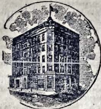
Наш власний дім.

100,000.00 доларів вложив наш банк в державну касу на обезпечення наших чинностей.