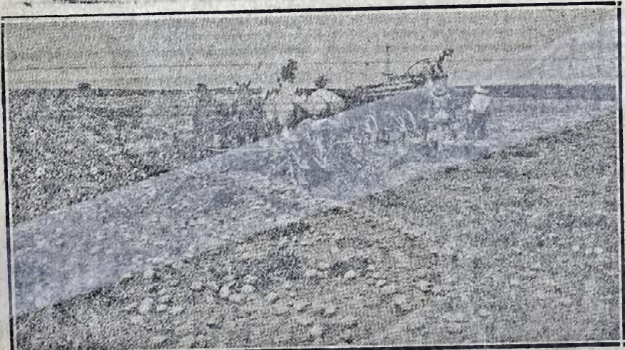
Команє бараболє на фармі в сусідстві Бріджтон.

чистий Guarantee Deed. — Зі сторони полуднево-східної наших ґрунтів нема навіть цілих 6 миль до великого міста Bridgeton, N. J. Bridgeton єсть містом повітовим, Cumberland County, і єсть осим портівим містом в Злучених Державах. Має 54 фабрик ріжних виробів, котрі тут подаємо: 3 Glass Manufacturing Plants; 2 Gasoline Engine Works; 5 Machine Shops; Electric Light and Power Plant; 3 Shirt and Shirtwaist Factories; 2 Iron Foundries; 2 Artificial Ice Plants; 3 Candy Factories; 2 Flour Mills; Illuminating Gas Plant; Wrapper Factory; 7 Fruit & Vegetable Packers; Dye and Bleaching Plant; Hosiery Mill; Plant for Condensing Milk; Lithographing Plant; Silk Dress Factory; Ship Yard; Mould Making Plant; Plant for the manufacture of Dies and Presses of every size; Turkish Towels and Bath Robing; Carriages and Wagons; Printing Presses; Steel Castings; Baskets; Tin Cans; Brick; Gloves. — Списє фабрик міста Мілвіл подамо пізнійше. — Інтересовані приїжджайте, доки маєте добру погоду, осудіть самі, чи не добре мати кавалок землі при великих містах та так численних фабриках і при шогодинній комунікації. — Перед приїздом просимо нас повідомити на понизшу адресу. Пишіть по руськи, бо в нашім бюрі займають уряди Русини.