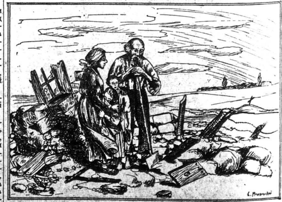
Вигнаючи з перебісшого поміт. по повороті до рідного села, на своїх обіста.

РОДИМЦІ! СКЛАДАЙТЕ ЖЕРТВИ НА ФОНД ВИЗВОЛЕННЯ УКРАЇНИ.