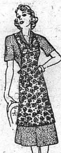
Ф. АРТУХ ДАРОМ за купони з порошку TARSON

МЕНШ 12 ПАЧОК ПОЧТОЮ НЕ ВИСИЛАЄМО. GRAMERCY CHEMICAL CO., Inc., 201 East 16th Street, New York, N. Y.