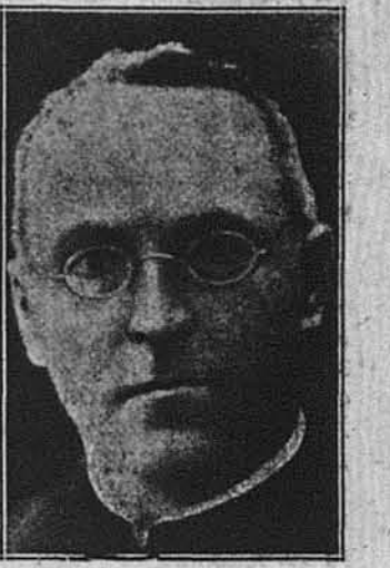
о. д-р Олександр Дамбравскас

Покійний був найбільшим литовським ученим теперішньої доби. Це навіть признають литовські-вільнодумці, хоч о. Дамбравскас був пралатом римо-католицької церкви.