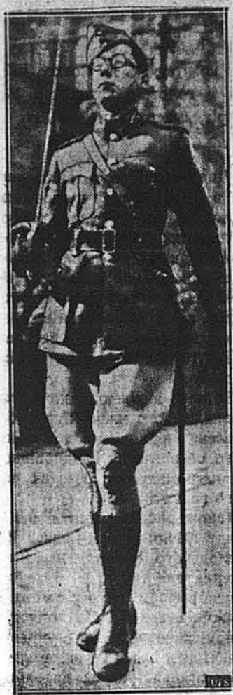
СИН ІРЛАНДСЬКОГО ПРЕ-М'ЄРА.

— Бо тоді дуже йдуть по-рохи, прошу пані!