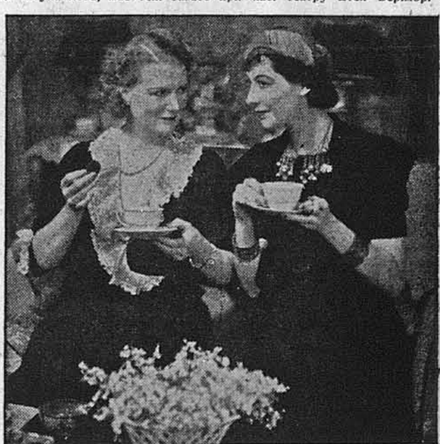
СПЛЕТНІ РОБЛЯТЬ СВОЮ СМЕРТЕЛЬНУ РОБОТУ.

Тепер продається білети на штуку "Вімен" до 7. травня. У величезній тиждень будуть ставити штуку теж сполудня: в середу, 20. квітня; у п'ятницю, 22. квітня; і в суботу, 23. квітня. Білети продаються тепер при касі театру Етел Берімор.