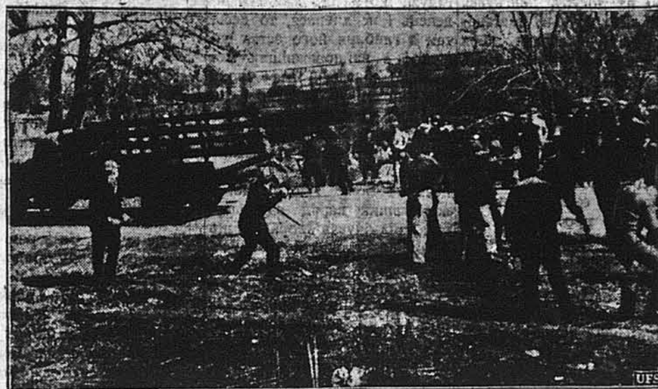
БІЙКА НА ТЛІ СТРАЙКУ.

НЬЮ ЙОРК. — На площі Світової Вистави розпочали будову театру, що міститиме 2,500 осіб. Цей театр буде побудований у цілковито модерному стилі. Зпереду буде виглядати як цегляний гангар, а ззаду буде мати сцену кубічного вигляду.