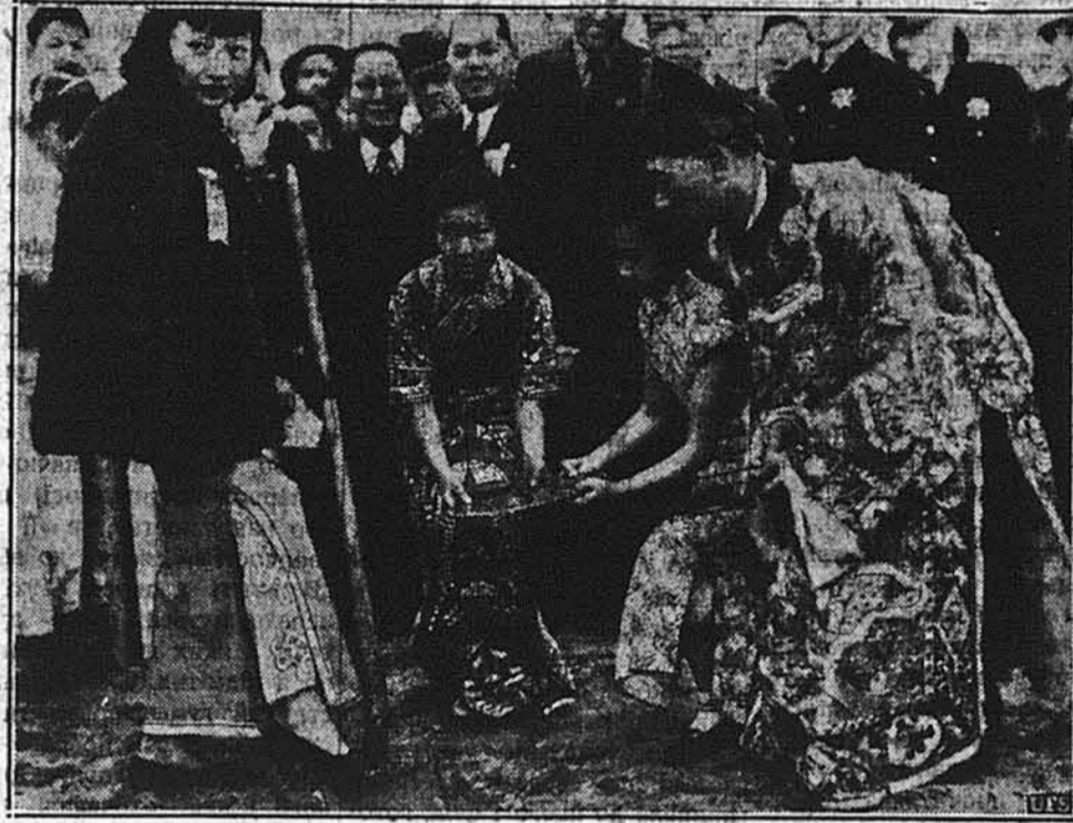
НАРОДИ НА СВІТОВІЙ ВИСТАВІ.

НЮ ЙОРК. — Минулої неділі на виставовій площі в Флоринг Медов відбулася велика парада, получена з ріжними штучними вогнями. В повітрі тріскали ріжні ракети, штучні бомби і закрашували небо ріжними красками. На тій параді було 600,000 осіб.