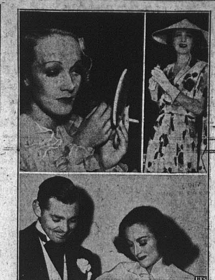
ВІЙНА В ФІЛЬМОВІЙ ПРОМИСЛІ.

В КОЖНІЙ УКРАЇНСЬКІЙ ХАТІ ПОВИНЕН ЗНАХОДИТИСЯ ЧАСОПИС „СВОБОДА“.