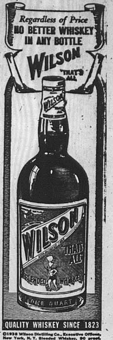
QUALITY WHISKEY SINCE 1823

Радіємо, що велика родина С. У. А. помножується, але рівночасно йдм назустріч потребам організації. Ряди наші збільшуються, жінки інстинктивно починають відчувати потребу організації, звязку між собою і потреби одного визначеного шляху. А де можна цей шлях знайти? Тільки в першій американській українській жіночій організації, а це: в Союзі Українок Америки. Бо тут члени не тільки знаходять інструкції про українську націю й культуру, а де і відділі С. У. А., то там їх організаційна праця впливає на громадянське життя наших людей. Таким шляхом американці і чужинці пізнають потребу познайомитися з українською справою. А це є велика користь для нас. Наші діти по школах і будуча генерація вже мають підготову до дальшої національної праці, бо набудуче українська мова уже не буде мусіти вчити американських професорів, що це таке „Ukraine“. Ми, українці, вже знаємо про українську долю, про слози і кайданки, але праця С. У. А. вимагає, щоб цілий культурний світ знав про 50-мільоновий нарід і його долю. Пікніки і прогульки ніколи нам цього