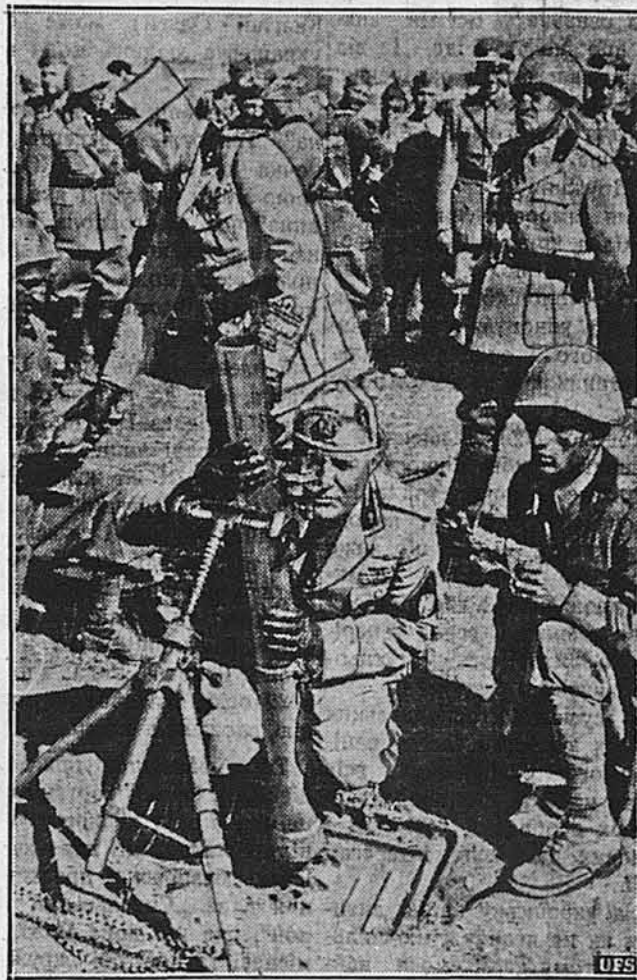
МУСОЛІНІ НА МАНЕВРАХ.