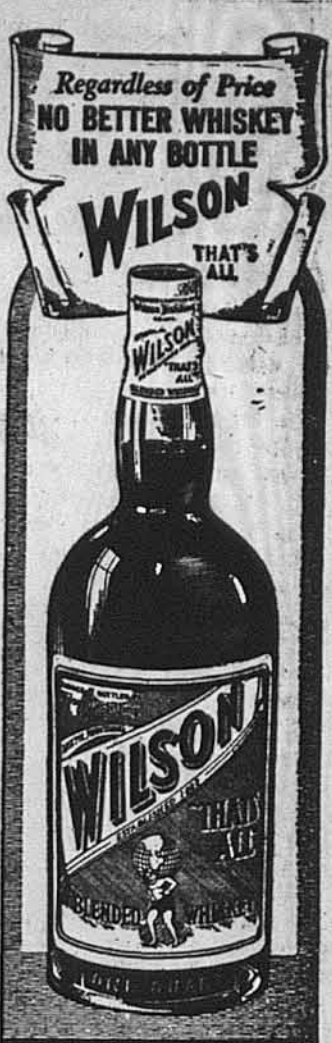
QUALITY WHISKY SINCE 1823 Wilson Distilling Co., Inc., N. Y. Blended Whisky. 90 proof. 72% neutral spirits distilled from grain.

Чи розвязка наступить через плебісцит, чи війну, українська справа входить у гру. Коли плебісцит перемаже, то українці з Закарпаття і по всьому світу домагаються самостійності для Закарпаття під протекторатом Німеччини для охорони самостійності.