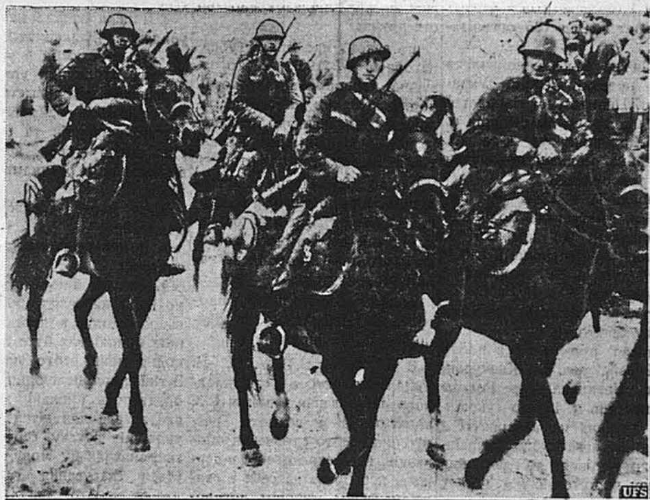
ЧИ БУДУТЬ БИТИСЯ?

За резолюцію промовляв на конвенції заступник стейтового губернатора, котрий домагався від юнії якогось реального плану для переведення засади в життя.