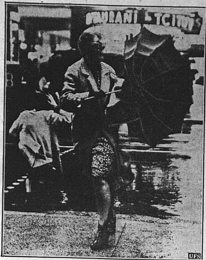
СЦЕНИ З ГУРАГАНУ.

В Кожній українській хаті повинен знаходитись часопис Свобода.