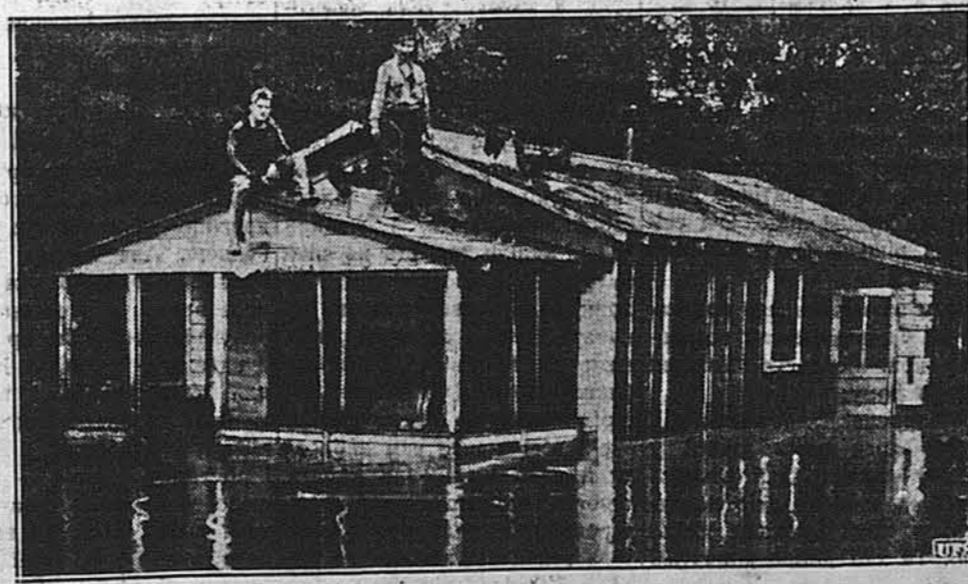
СЦЕНА З ПОВЕНІ.

ЛОНДОН. — Англія і Франція, а також Америка, рішили звернутися з апелем до Гітлера, щоб він передумає ще раз свої домагання і змодифікував їх, та щоб мирним способом старався полатити чехословацьке непорозуміння.