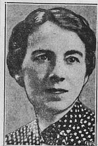
ЖІНКА ДО КОНГРЕСУ.

Коли гурагановий вітер досягнув уже 75 миль на годину, боротьба проложих з вітром була звичайною сценою на вулицях Нью Йорку. В Гартфордї, Конетикот, вітер досягнув над містом скорости 185 миль на годину.