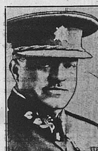
ГОЛОВНИЙ КОМАНДАНТ ЧЕСЬКОЇ АРМІЇ.