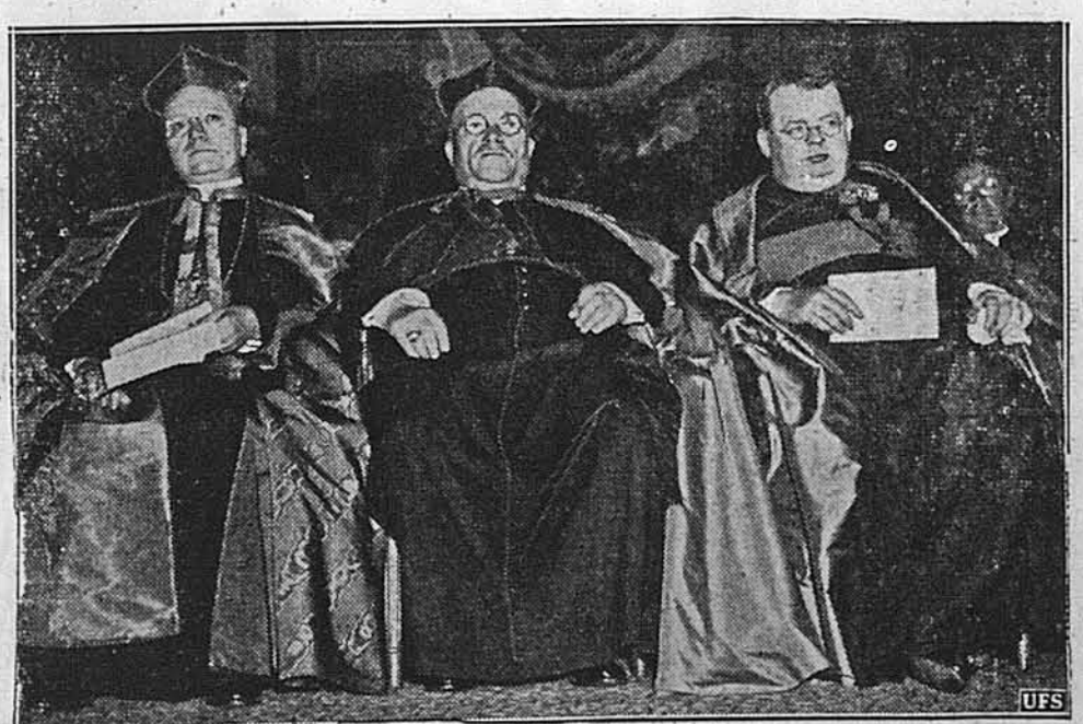
ЗОЛОТИЙ ЮВІЛЕЙ КАЄ ЛІЦЬКОГО УНІВЕРСИТЕТУ.

Католицькі достойники на Золотому Ювілею Католицького Університету у Вашингтоні (зліва направо): Амлето Чіґ оняні, апостольський делеґат; Дєніє Догєрті, кардинал з Філадельфії; та Джозєф Коринґєн, ректор університету.