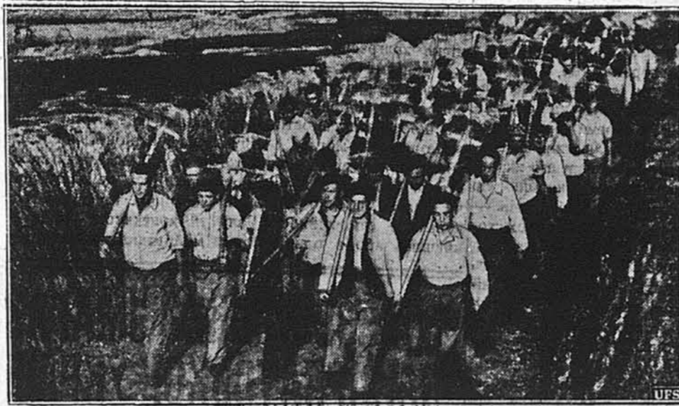
ДЛЯ БЕЗРОБІТНИХ У ЧЕХІІ.

ВАШИНГТОН. — На нереслужанні перед конгресовим комітетом Даеса станує Джеймс Коб, мурин, адвокат і бувший суддя, і закидав секретареві внутрішніх справ, Ікесові, що він не виступив проти заряду Говардського університету, муринської установи, піддержуваної почасті федеральними грішми, як Коб доніс президентові університету й секретареві Ікесові, що президент університету похваляє комуністичний уряд Росії.