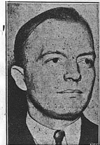
НОВИЙ ГУБЕРНАТОР МІНЕСОТИ.

На останніх виборах губернатором стейту вибрано Гарольда Стасена, кандидата Республіканської Партії. Стасен родився на фермі, добув собі освіту, заробляючи при тому на життя як помічник у крамниці. Він має в собі кров німецьку, шведську й чеську.