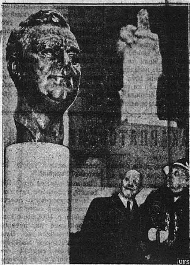
ВІДСЛОНОЄ ПАМ'ЯТНИК СИНОВІ

ВАШИНГТОН. — Президент затвердив назначення нового шефа штабу Американської Армії на місці уступилого ген. Крейга. Новий шеф штабу є ген. Маршал і він має 58 літ.