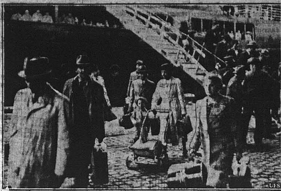
ПРИТУЛОВИЩЕ ДЛЯ ВТІКАЧІВ.

Жидівські втікачі з Німеччини, котрим не дозволено висісти на Кубі, дістали право висісти на беріг в Антверпії, в Бельгії.