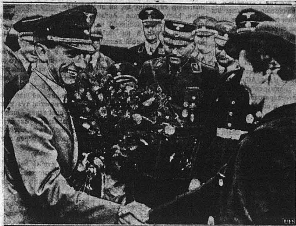
ГЕБЕЛЬС У ДАНЦІГУ.

Фарлі виїжджає незадовго з Нью Йорку з своїми двома дочками.