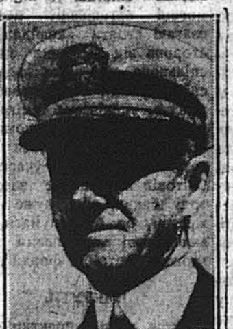
АДМІРАЛ ТОМАС ГАРТ,

І. Ш., Нью Йорк, Н. Я. — Не знаємо, чи в американській війні з 1775 р. брали участь українці. Це ніде не записано. — Мотор по українськи називається також мотор. Це модерна назва, латинського походження і вона прийнялась у всіх дарах. Є теж у нас спроби називати мотор своїм власним словом „рушій“, але те слово ще не прийнялось широко. — Словар Грінченка, котрий вийшов 1909 р. і не є повний, має 73 тисячі слів. До того приїде велике число технічних виразів, які ще не є усталені. В буденному житті пересічний чоловік, без вищої освіти, вживає 3 до 4 тисячі слів. В літературі письменники пересічно вживають до кільканих тисяч. — Краще лікаря називати так лікарем, а не доктором, а то тому, що українське слово відразу означає свою професію, коли слово „доктор“ означає тільки науковий титул. Є доктори медицини, філософії, прав, природничих наук і т. п. Коли однак хтось звертається до лікаря із запитом, то краще вжити наукового титулу „доктор“ ніж „пане лікарю“. Слово доктор походить від латинського „доцере“, значить „учитись“. Доктор це — „вчений“.