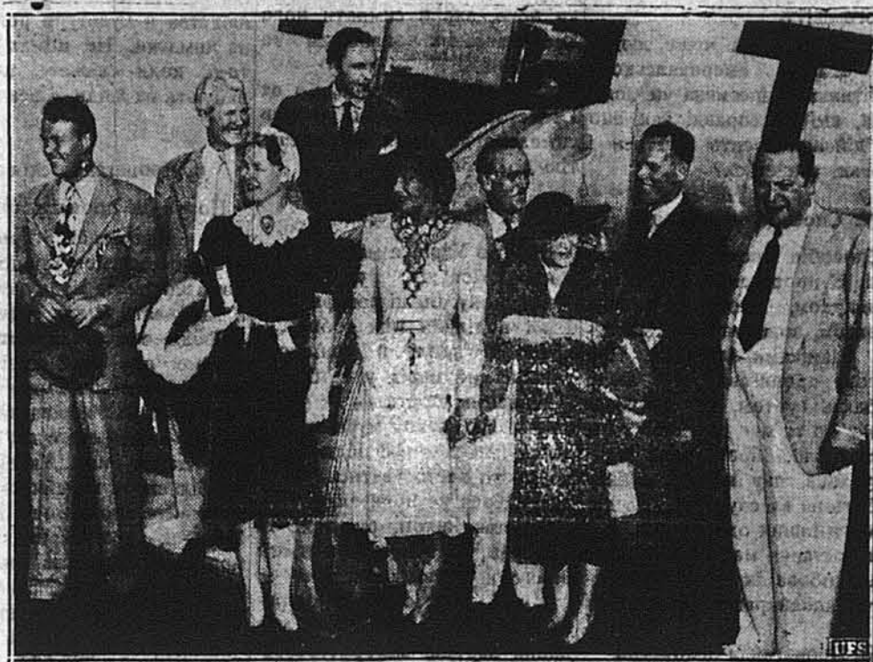
ВІДОМІ ОБЛИЧЧЯ В НОВІЙ РОЛІ.

ВАШИНГТОН. — Як каже Краєва Рада Контролі Амуніції, від якого року, коли Америка завела проти Японії „моральну ब्लюкаду“, Японії не продано ні одного літака, хоч Англія й Франція робили тут зовсім поважні закупа воєнних літаків.