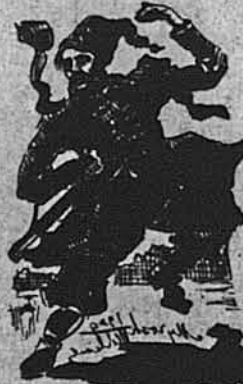
Kozak "Kibalka" will dance at the SURMA RADIO BALL.

СПЕЦІАЛЬНА АТРАКЦІЯ: УКРАЇНСЬКІ АРТИСТИ З БРОДВЕЮ, КОЗАК КИБАЛКА. Всіх Українців з близької і далеко запрошує на цей РАДІО БАЛЬ-КОНТЕСТ Бальний Комітет.