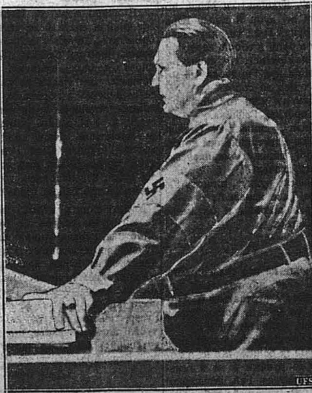
МАРШАЛ ГЕРМАН ГЕРІНГ.

На областях здолунівського і рівненського повітів скарбова влада викрила 12 тайних горалень... у човнах. „Фабриканти” продукували самогін уночі, а в день ховали апарати в копичі сіна. Всіх їх потягнули до судової відповідальності.