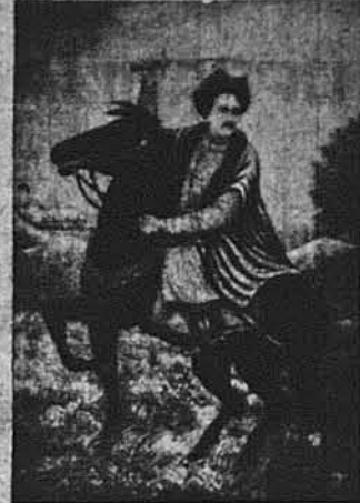
Гетьман Іван Мазепа.