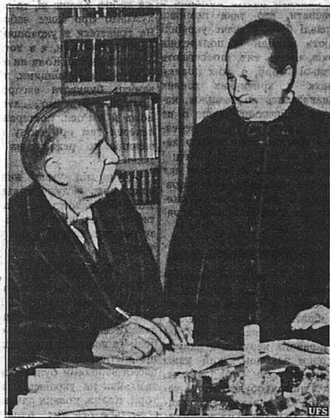
КЮСТІ КАЛІО, ПРЕЗИДЕНТ ФІНЛЯНДІ, І ЙОГО ЖІНКА.

УВАГА! Д-Р КЛІВЛЕНД І ОКОЛИЦЯ! УВАГА! УКРАЇНСЬКА ПРАВОСЛАВНА ПАРОХІЯ ім. СВ. КН. ВОЛОДИМИРА В КЛІВЛЕНДІ, О. влаштує 3 ПРИВІДУ 15-ТИЛІТНЬОГО ЮВІЛЕЮ ЗАСНОВАННЯ ПАРОХІЇ В НЕДІЛЮ, ДНІ 25-го ЛЮТОГО (FEB.) 1940. АРХІЄРЕЙСЬКУ СЛУЖБУ БОЖУ яку відправляє Архієпископ ІОАНН ТЕОДОРОВИЧ, при асисті парохіа о. П. Білона. — Початок Служби в год. 10. рано. В той же день буде відправлена Архієрейська Вечірня і Супікація при участі доколических священників. Вечірню співатиме хор Пітсбургської правос. Громади під орудою М. Желехівського. Проповідан виступить о. Владика. Початок Вечірні 4:30 попол. По Вечірні відбудеться в своїй салі БЕНІКЕТ для гостей. Після Бенкету будуть промови, привіт і різном: відбудеться КОНЦЕРТ, — виступатиме хор з Пітсбурга під орудою М. Желехівського, будуть виставлені національні танки. — На це свято Комітет запрошує місцевих і позамісцевих громадян.