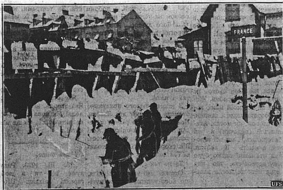
І ЦЕ НАЛЕЖИТЬ ДО ВІЙНИ.

КОПЕНГАГЕН. — Военний кореспондент доносить з фінсько-советського фронту, що знищення фіними 18. советської дивізії виставило на велику небезпеку 164. советську дивізію, яка відірвана від звязку з іншими советськими частинами.