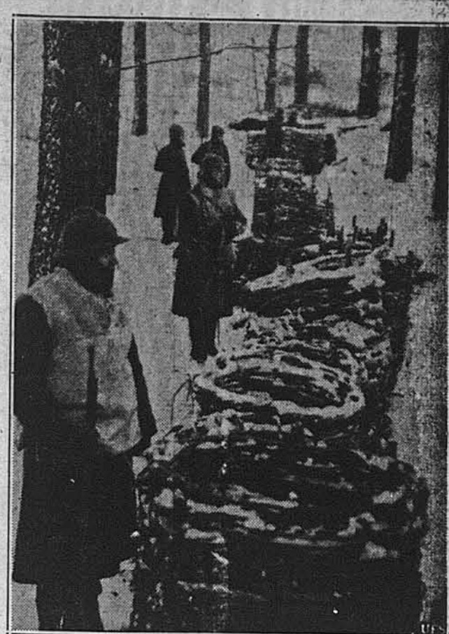
ЯК СНІГ УПАДЕ НА ФРОНТІ, ТРЕБА СКРИПИТИ СТОРОЖІВ ДЛЯ СЛІДЖЕННЯ РУХІВ ВОРОГА. Французькі жовнири стоять коло звоів колючих дротів.

Торкаючись українсько-американської еміграції, виказував шкідливість творення різних груп, висилання різних делегацій, котрі самі себе побивають. Благав за всяку ціну прийти до порозуміння, бо лише об'єднані зможемо доби-