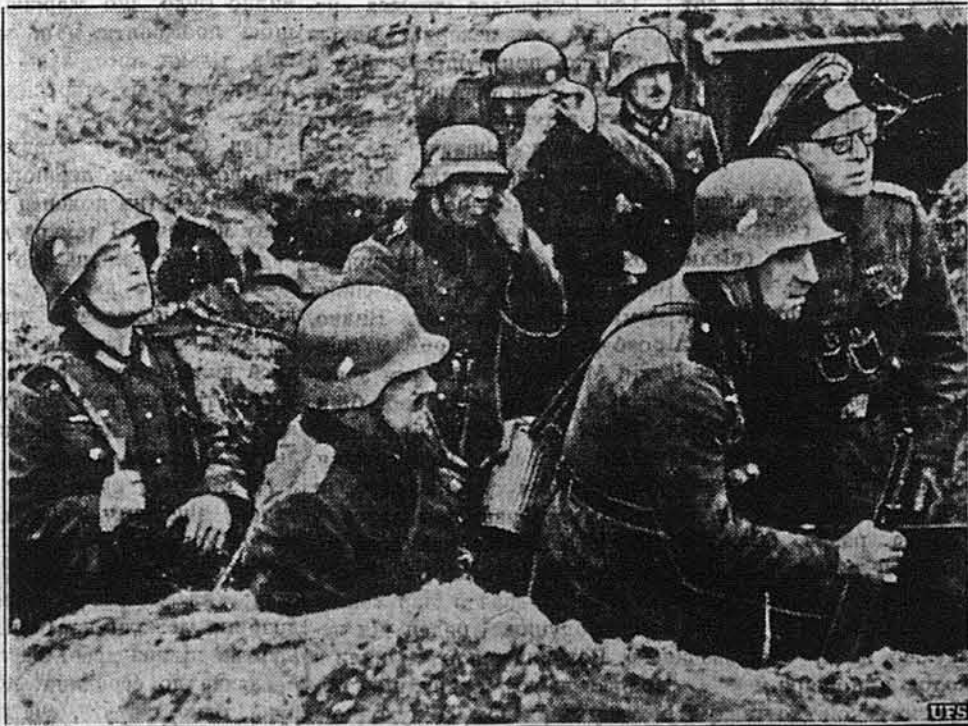
НІМЕЦЬКА ФРОНТОВА ПОЗИЦІЯ.

ПРАГА. — Видано розпорядок, яким звільняється з урядових посад усіх тих, що подружені з жидівками, якщо вони не візьмуть розводу. В такий спосіб чим далі тим більше вводять у протектораті в житті ті протижидівські закони, що є обов'язочними в Німеччині.