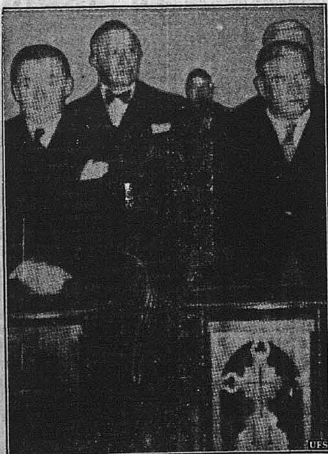
МОЛИТВА ЗА ПЕРЕМОГУ.

Французькі лідери на богослуженні за французьку перемогу в церкві Нотр Дам у Парижі.