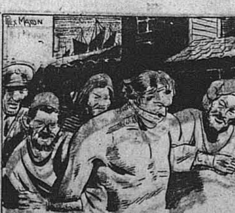
MARIKA NEED NOT HAVE ACTED. TARZAN, EFFECTIVELY GAGGED, WAS BEING BROUGHT TO THIS VERY SHIP WITHIN RANGE OF HER CHARMS.

Після того, як поневолено Джейн, княжна Маріка стала певною, що їй таки вдасться заманити Тарзана до її корабля.