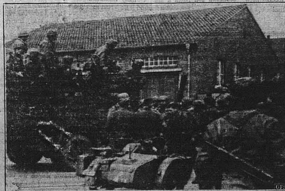
НІМЕЦЬКІ ВІЙСЬКА ЗАЙМАЮТЬ БЕЛЬГІЙСЬКИЙ ФОРТ ЕБЕН ЕМАЕЛЬ КОЛО МІСТА ЛІЖ У БЕЛЬГІЇ.

Мовляв, у періоді від січня до квітня цього року фабрики металургічного промислу виконали лише одну третину наміченої продукції.