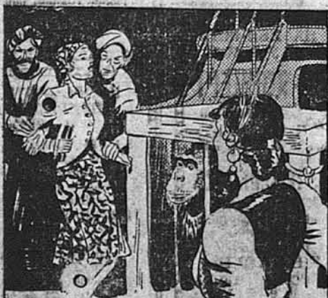
WITH JANE A PRISONER, MARIKA KNEW SHE COULD LURE TARZAN TO HER SHIP.