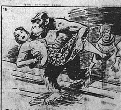
FLINGING ASIDE THE TERRIFIED GUARDS, THE HUGE BEAST SEIZED JANE, LEAPED TO THE DOCK AND FLED.