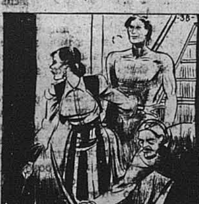
WITH A PITIFULLY SMALL DAGGER, MARIEL TRIED TO DEFEND THE SIGHTLESS TARZAN.

Та саме в тій хвилі, коли втікати вагались, гурт-піратів, що заховався в долині, напав на них.