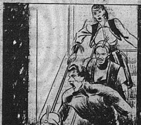
"QUICK!" URGED MARIEL, WHO WAS BEWILDERED BY THE MYSTERIOUS CRY, BUT EVEN MORE BY TARZAN'S ANSWER TO IT.

Марієка звеліла своїм людям чимскорше поспішати не лиш тому, що налякалась дивного крику з низу, але також тому, що Тарзан відповів на той крик.