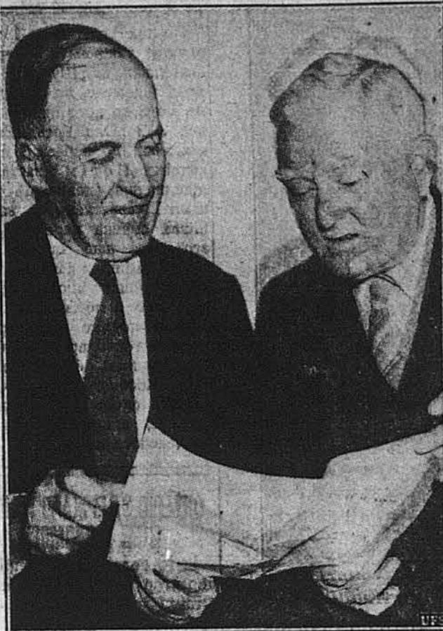
СЕНАТОР БЕРК ПОКАЗУЄ ВІЦЕПРЕЗИДЕНТОВІ ГАРНЕРОВІ СВОЙ ПРОЄКТ ЗАКОНА ПРО "ВИСЬКОВИЙ" ВИШКІЛ.