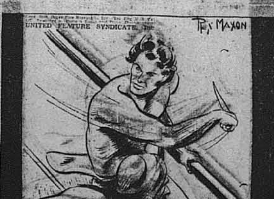
THE APE-MAN HIMSELF LASHED OUT BLINDLY WITH HIS KNIFE, HEROIC IN THE FACE OF CERTAIN DEFEAT.

Зо смішно-маленьким штилетом Марієка пробувала оборонити сліпого-Тарзана-перед піратами.