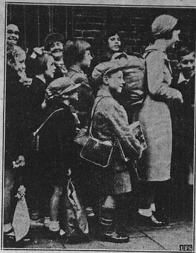
ВИВОЗЯТЬ АНГЛІЙСЬКІ ДІТИ З ЛОНДОНУ.

Що з цього вийде — не треба й згадувати. Прецінь і сильні держави падають через брак громадянської суцільності! Ньюйорська українська