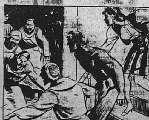
IN THIS MOMENT OF CONFUSION, A DETACHMENT OF PIRATES, WORKING BELOW, CHARGED THE FUGITIVES.

Марієка звеліла своїм людям чимскорше поспішати не лиш тому, що налякалась дивного крику з низу, але також тому, що Тарзан відповів на той крик.