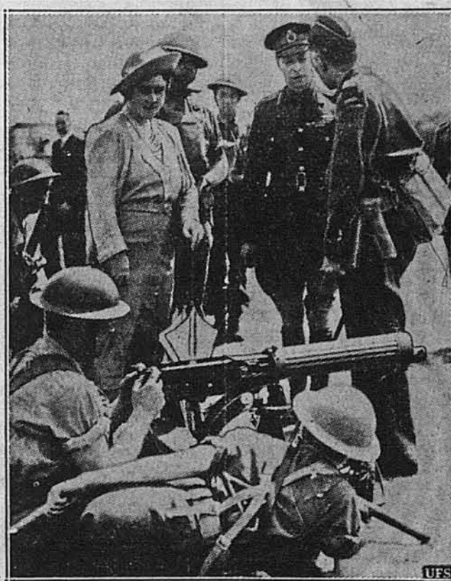
АНГЛІЙСЬКА КОРОЛІВСЬКА ПАРА ВІДВІДУЄ КАНАДІЙСЬКИЙ ПОЛК.