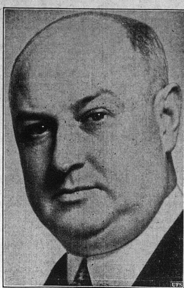
ДЖЕРИМС А. ФАРЛІ, що заявив, що конвенція Демократичної Партії дістане й його ймення як кандидата Партії на уряд президента Заучених Держав.