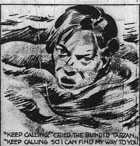
"KEEP CALLING" CRIED THE BLINDED TARZAN. "KEEP CALLING SO I CAN FIND MY WAY TO YOU."