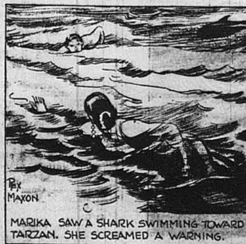
MARIKA SAW A SHARK SWIMMING TOWARD TARZAN. SHE SCREAMED A WARNING.