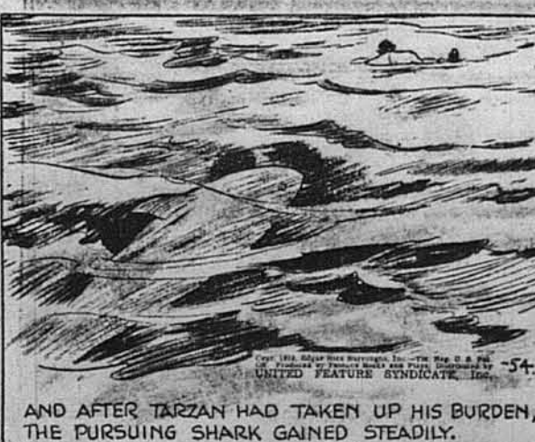
AND AFTER TARZAN HAD TAKEN UP HIS BURDEN, THE PURSUING SHARK GAINED STEADILY.

І Маріка побачила, як людоїд підпливав до Тарзана. Вона крикнула насторогу.