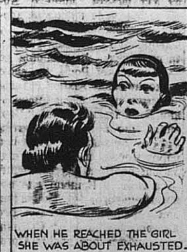
WHEN HE REACHED THE GIRL SHE WAS ABOUT EXHAUSTED.