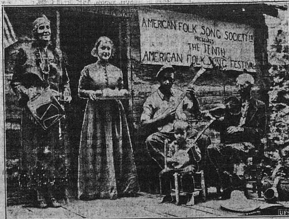
І АМЕРИКАНЦІ ЗА ПІДДЕРЖАННЯ СВОЇХ НАРОДНИХ СПІВІВ. В Ашленді, Кентокі, відбувся недово-тому конгрес американських народних співаків.

РИМ. — Італійські газети продовжують нападливу кампанію проти Америки, закидаючи їй між іншим „брак зрозуміння вищих доктрин і суспільних чеснот фашизму”.