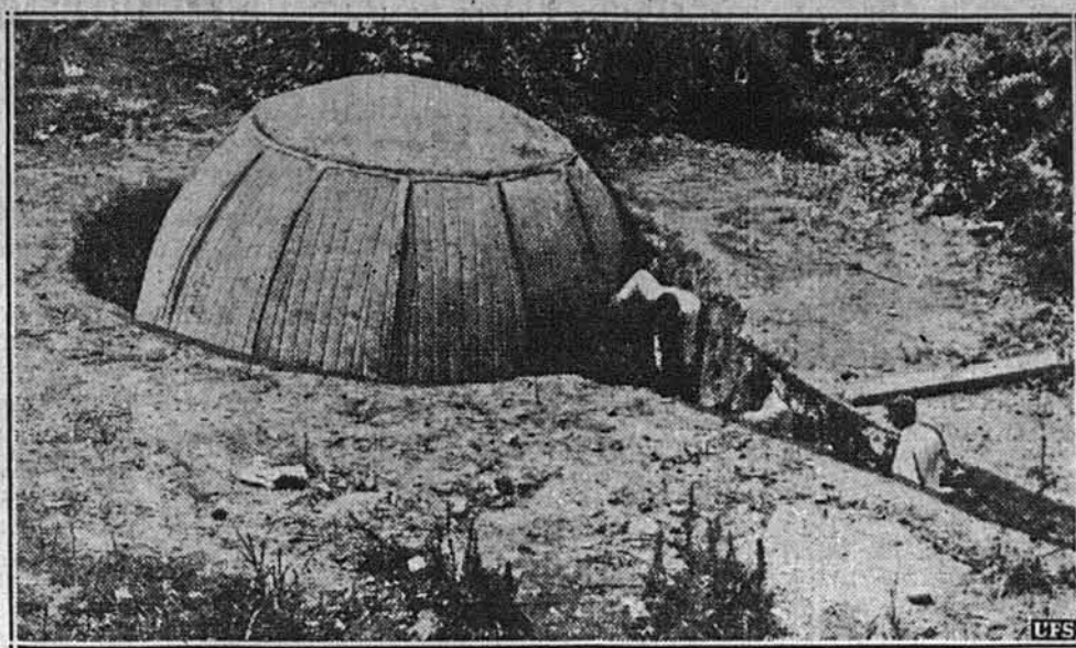
ЗА П'ЯТЬ ГОДИН.

Католицький священик у Швейцарії вправляє в стрільні з револьвера на стрільниці.