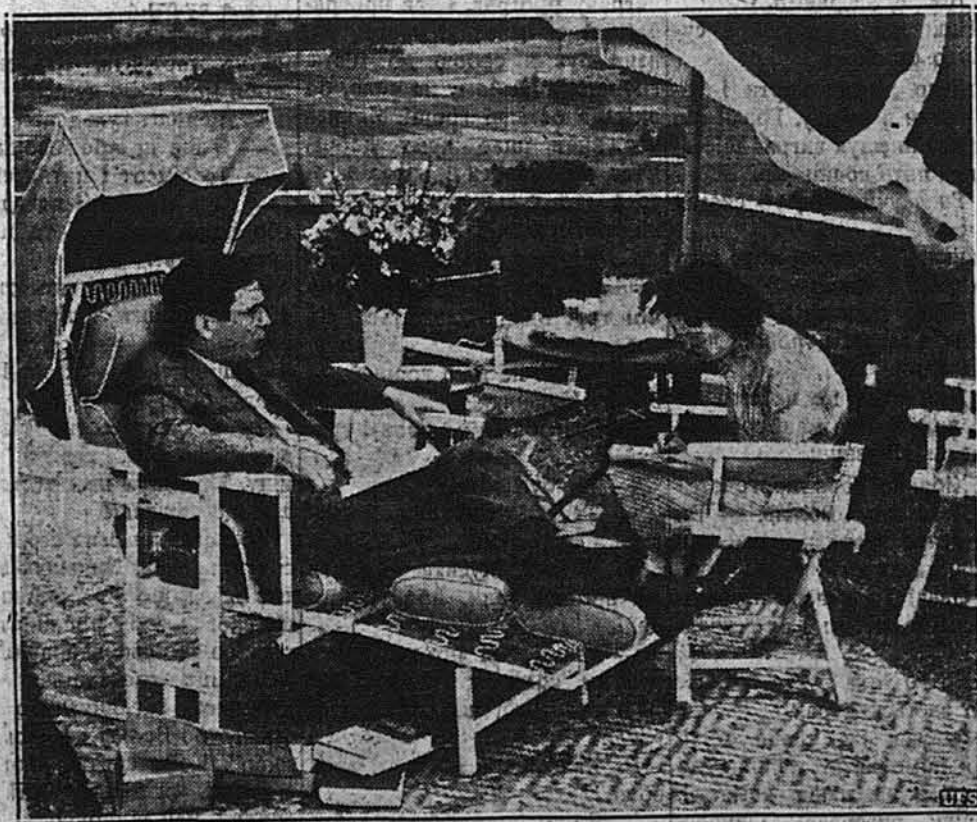
ВІЛКІ ПРИГОТОВЛЯЄ ПРОМОВУ ПРО ПРИНЯТТЯ НОМІНАЦІЇ.

БУКАРЕШТ. — Опираючись на тім, що вони є спадкоємцями всякого майна, яке належало колись до Чехословаччини, німецькі представники в Румунії перебрали на користь Німеччини заряд найбільших румунських фабрик зброї.