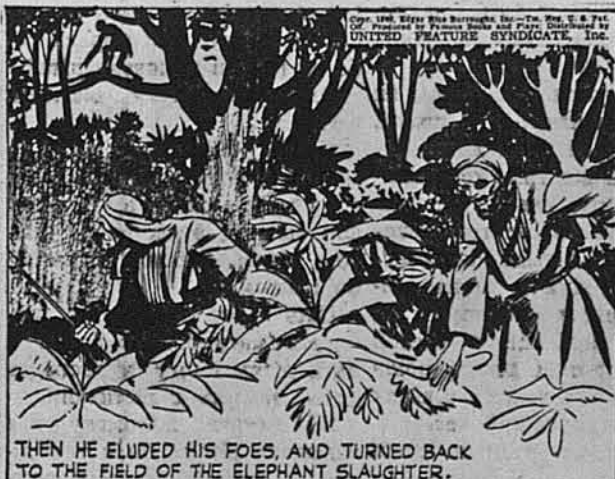
THEN HE ELUDED HIS FOES, AND TURNED BACK TO THE FIELD OF THE ELEPHANT SLAUGHTER.

Там він планував небезпечну гру, являючися часто так, щоб лише відтягнути дощів від слонів.