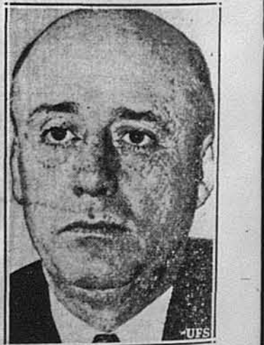
НОВИЙ ПРЕДСІДНИК ПАЛАТИ ПОСЛІВ.

— Пів відсотка самоходових нещасливих пригод і 4 відсотки випадків смерті трапляються на залізничних перехрестях.