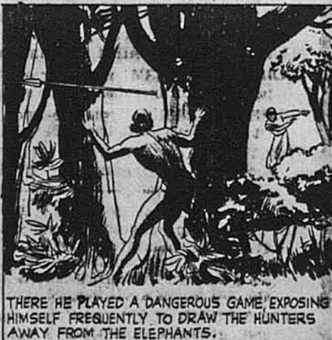
THERE HE PLAYED A DANGEROUS GAME, EXPOSING HIMSELF FREQUENTLY TO DRAW THE HUNTERS AWAY FROM THE ELEPHANTS.

Заки пошукувачі за слонову кістку могли його окружити, Тарзан кинувся на дерева.