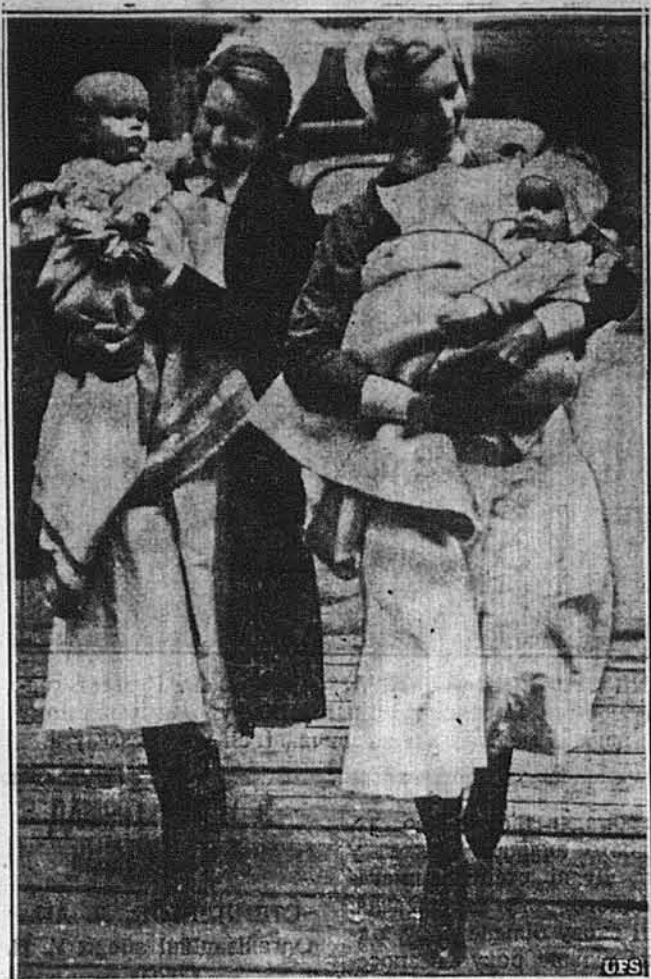
НА БЕЗПЕЧНЕ МІСЦЕ. — Англійські шпитальні послугачки під час рейду гітлерових летунів переносять у шпиталі діти в безпечне місце.