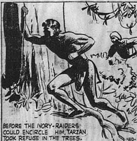
BEFORE THE IVORY-RAIDERS COULD REFUSE HIM, TARZAN TOOK REFUGE IN THE TREES.

Заки пошукувачі за слонову кістку могли його окружити, Тарзан кинувся на дерева.