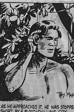
AS HE APPROACHED IT, HE WAS STOPPED SHORT BY A BLOOD-CHILLING CRY.

Потім знову він висмикнувся своїм гонителям і пігнав на поляну, де лежали побиті слони.