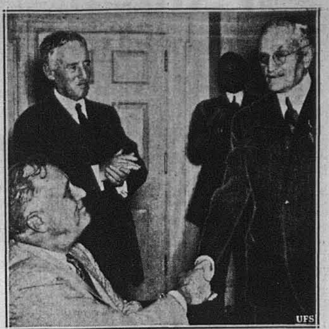
ВІДЗНАЧЕННЯ ЖОВНІРА. — Президент Рузвельт гра-тує ген. Першингові з нагоди 80. уродин, коли йому надано медалю за надзвичайні військові заслуги.

Щоб дістати таку допомогу, сліпа людина, коли вбога, повинна віднести до найближчого публічного добродійного бюро. Мусить доказати, що не має з чого жити, і цілком сліпа, або що її зір так слабкий, що не може заробляти на своє вдержання. Більшість стейтів не питає