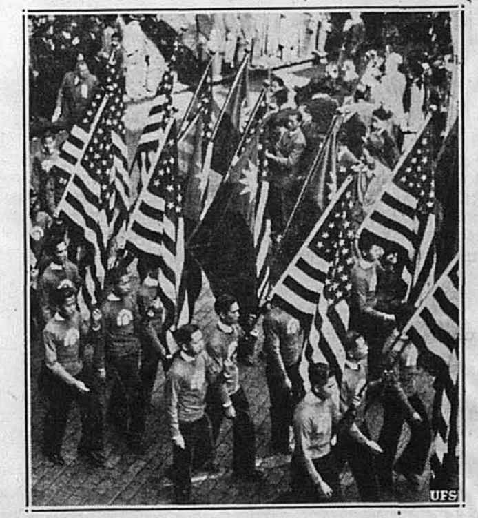
КИТАЙЦІ СВЯТКУЮТЬ. — Ньюйорські китаїці відсвяткували оноді 29. річницю повстання китаїської республіки.

ВІПНІ. — Ввійшли в життя нові закони, звернені проти жидів. Особливо вдаряють вони тих жидів, що були заняті в пресі, радіо, й фільмовій продукції, звідки їх цілковито усунуено.