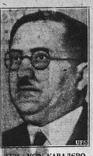
ТЕН. УГО КАВАЛЕРО,

новий начальник італійського генерального штабу, наступник маршала Пієтра Бадолія.