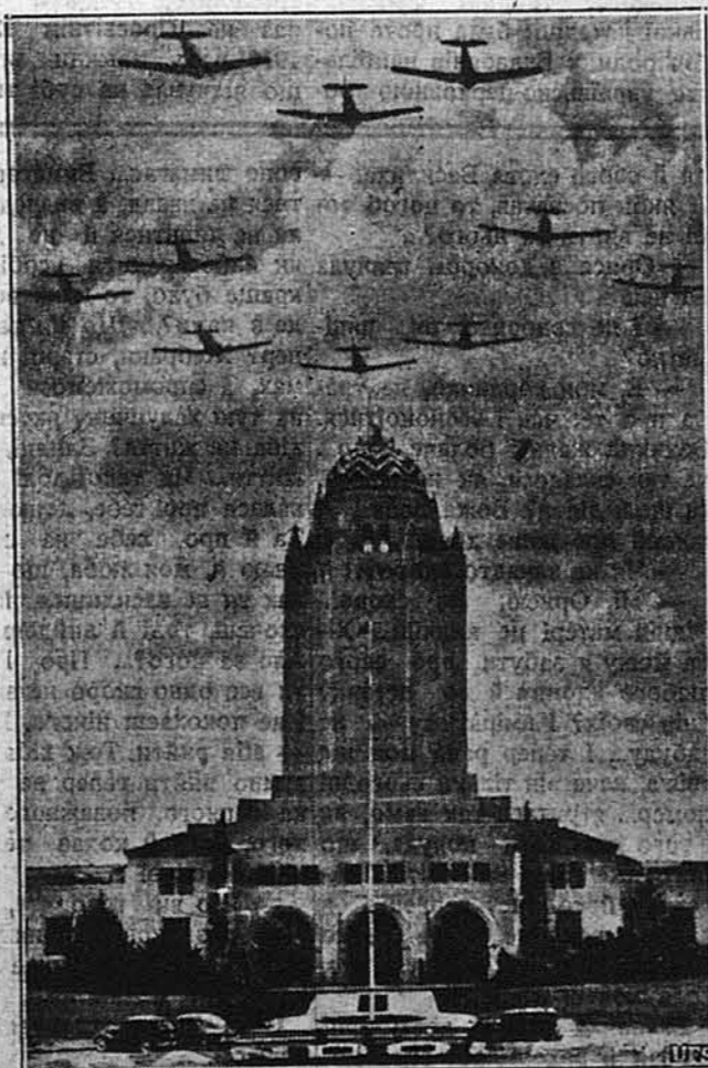
АМЕРИКАНСЬКІ ЛЕТУНИ. — Коло 350 американських військових летунів перелетіло підчас летунських вправ в один день понад адміністративний будинок летниста Рендолфа в Тенсасі.

З Югославії доносять, що вже є в Альбанії німецькі відділи. Між іншим є ті німецькі летуни, що то спускаються в долину і скидають бомби на будинки, літаючи майже над самими дахами. Далі кажуть, що у зв'язку з подіями в Альбанії мають німці скріпляти свої воєнні сили в Румунії.