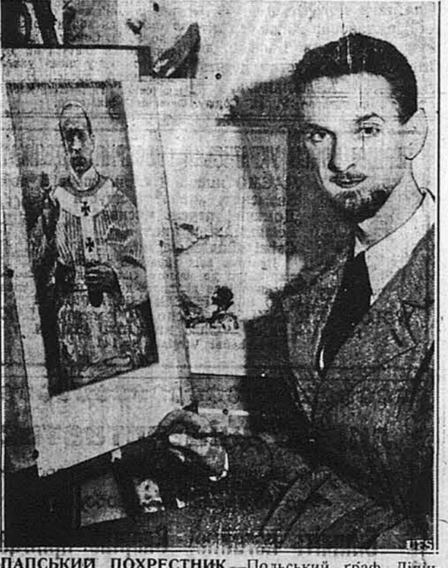
ПАПСЬКИЙ ПОХРЕСТНИК. Польський граф Ліпінський виставив у Клівленді рисований портрет папи римського Пія, котрий, як каже граф, будучи молодим священиком, був йому хрестним батьком.

НЕБІЖЧИК ХОДИТЬ Історичне оповідання про цікаві шляхетські й купецькі інтриги в часі, коли Історична Польща правила Україною, а турки правильно наїжджали на неї на грабін. ЦІНА 75 ЦЕНТІВ. "5 U O B O D A" 81-83 GRAND STREET, P. O. BOX 346, JERSEY CITY, N. J.