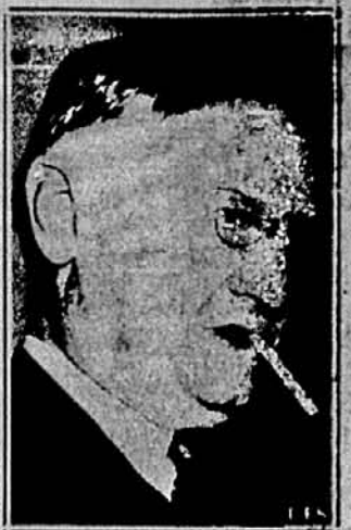
ГЕН. РОБЕРТ ВУД, президент „Америка Ферст Коміті“, ставав перед Сенатським Комітетом для заграничних справ як свідок проти ухвалення „закону про пожичку-аренду“.

Лучалося однак, що у більшш свідомім селі вибирано ви-