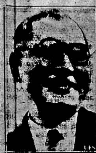
АДМІРАЛ КІЧАСУРО НОМУРА новий японський амбасадор у Вашингтоні.

Третя ґруна-штучних угноєнь, калійні або потасові погнії — для нас не менше важ-