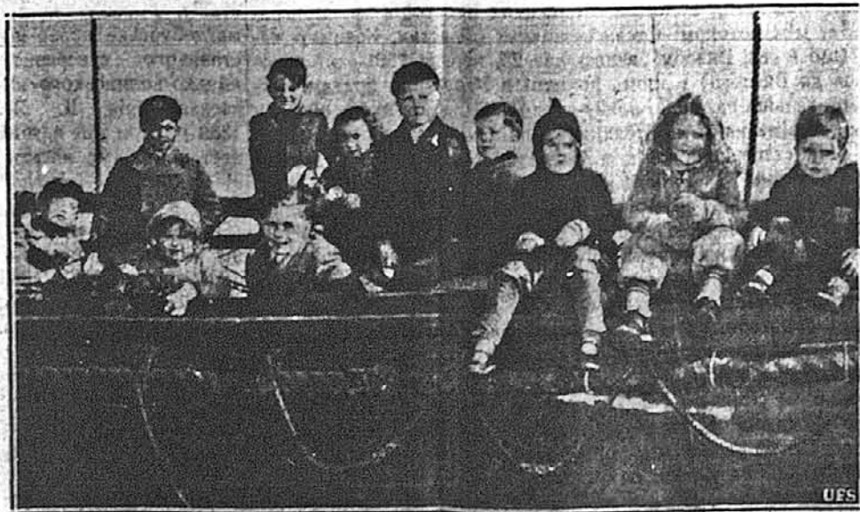
НАЧАС ТРИВАННЯ ВІЙНИ. На британському кораблі „Джордж“ привезено 6 поді з Англії до Америки нову громадську дітей, котрих мають тут задержати, як довго буде тривати війна.

Як в Берліні думають напасти на Англію, так тепер в Англії розробляють план британського нападу на Італію. Очевидно, це булоб першим кроком перенесення британської війни на європейський континент, бо так є, що конець кінців Британія буде змушена кінчити війну на європейській землі, бо тільки там буде можна розгромити німців і віднести справжню воєнну перемогу. Недавнє скидання парашутистів на Італійську землю вважається в Англії першою спробою виландування вояків на чужій землі. Та в газеті Мусоліні в Римі розуміють це так, що британські парашутисти мали захитати мораль італійського населення. Та так не сталося, пише згадана газета, бо ця подія вважають в Італії „малим епізодом“.