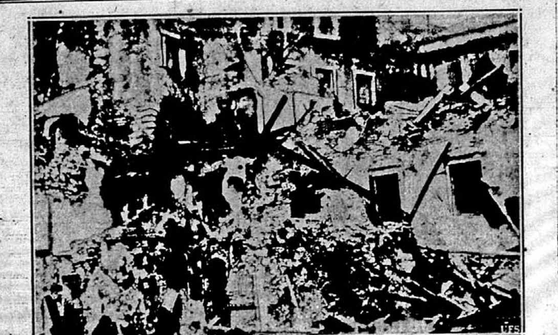
НАСЛІДКИ ІТАЛІЙСЬКОГО БОМБАРДУВАННЯ ГРЕЦЬКОГО ОСТРОВА КОРФУ З ПОВІТРЯ.