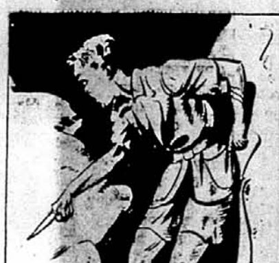
TREMBLINGLY HE AWAITED THE ATTACK.