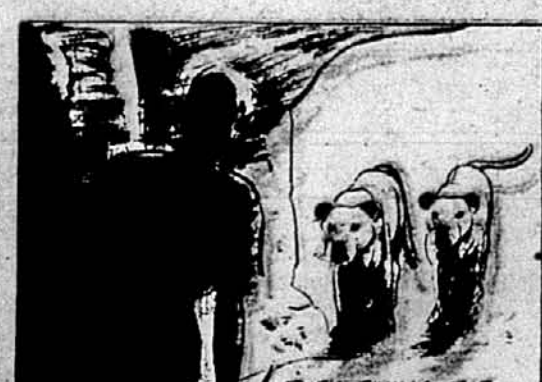
THEN, FIXING THE BOY WITH THEIR FLASHING EYES, THE SMALL BEASTS AD-VANCED.

Том підскочив вгору, а далі відступив назад. Тепер він побачив перед собою два мо-лоді льви, що споглядали на нього з печери.