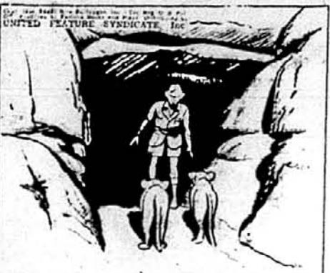
TOMMY LEAPED UP AND JUMPED BACK. BEFORE HIM STOOD TWO LION CUBS, BLOCKING HIS EXIT FROM THE CAVE.