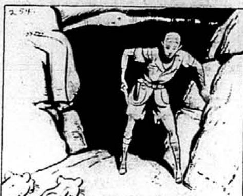
THE FRIGHTENED BOY WHIPPED OUT HIS KNIFE. TO HIM LIONS WERE LIONS, NO MATTER WHAT THEIR SIZE