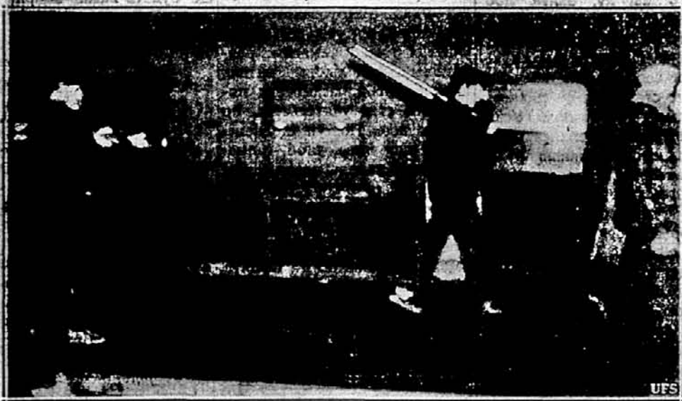
СЛЕЗОТОЧИВІ БОМБИ В СТРАЙКУ. — Полісмен націлюється рушницею для ви- кидання слезоточивих бомб на страйкарів сталевих фабрик в Бетлєгемі. Поліція каже, що рушниця в руках поліцей, показаного на цій світліні, вистрілила без волі поліцей. У заворушеннях були ранені поліція й страйкари.

В КОЖНІЙ УКРАЇНСЬКІЙ ХА- ТІ ПОВИНЕН ЗНАХОДИТИСЯ ЧАСОПИС „СВОБОДА”.