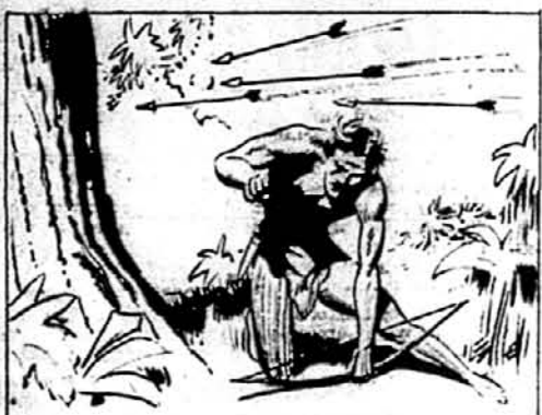
AN INSTANT BEFORE THE VOLLEY WAS DISCHARGED, TARZAN DROPPED TO ONE KNEE, THE MISSILES SAILED OVER HIS HEAD.