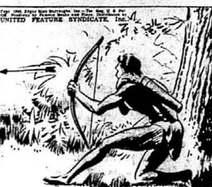
THEN HIS RIGHT ARM SHUTTLED BE- TWEEN QUIVER AND BOW, WITH MACHINE- GUN RAPIDITY THREE ARROWS SPLIT THE AIR.