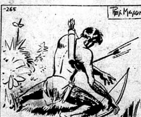
BUT THE FOURTH FIRED, THE ARROW SPED TRUE — AND STRUCK TARZAN!

Хвилюючку перед тим, як стріли просвітлили понад го- лову Тарзана, він приляк- нув на одно коліно. Вони пройшли мимо.