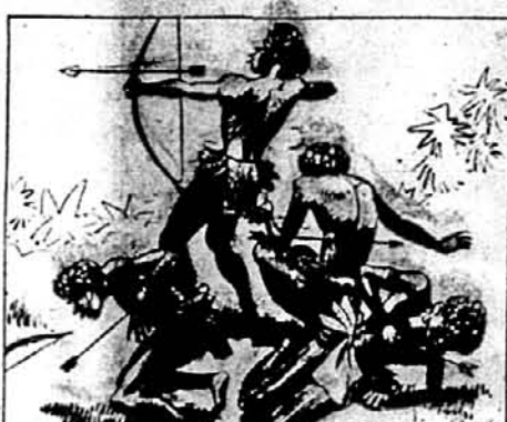
THREE OF THE SAVAGES FELL BEFORE THEY COULD RELOAD THEIR BOWS.