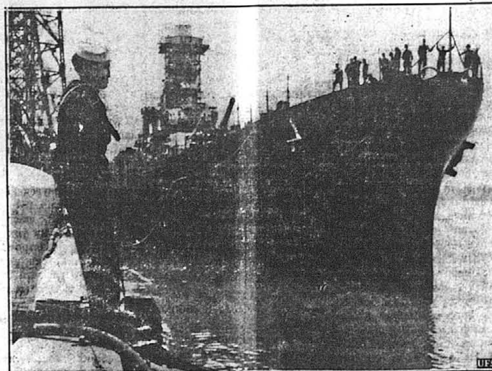
ЩЕ ОДИН ДЛЯ ВУЙКА СЕМА. — З дня 15. травня починає повинити службу в флоті Злучених Держав цей 35,000-тонний корабель „Вашингтон”. Світлина показує приготування корабля для врочистих церемоній.

Британська Прес Сервіс подає, що вісти про „неспокої в Палестині” мають „фантастичний” вигляд і є вдумкою нацистської пропаганди. В Палестині, кажуть британці, так спокійно, як ще ніколи.