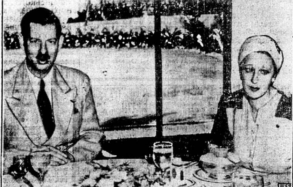
Б. КОРОЛЬ НА ВИГНАННІ.—Карло, бувший король Румунії, й пані Люпеску сидять у Готель Насіональ у Гавані, на Кубі, де вони тепер задержалися по своїй утечі з Європи. Карло сподівається жити постійно на Кубі.

В КОЖНІЙ УКРАЇНСЬКІЙ ХАТІ ПОВІНЕН ЗНАХОДИТИСЯ ЧАСОПИС „СВОБОДА”