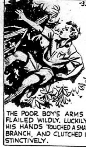
Справді замало було в ньому сили, щоб на галузі задержатись, але він бодай ослабив розгін і ціло скочив на землю.