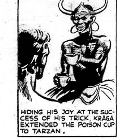
Скриваючи свою велику радість, що отсє Тарзан ловиться на придуманий ним гачок, ворожит Крага подав йому отруту.