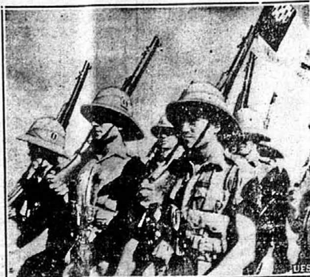
ВІДДІЛ „ВІЛЬНИХ ФРАНЦУЗІВ“, ЩО ПОМАГАЄ БРИТАМ У СИРІ.