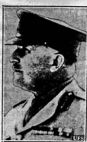
ГЕН. ГЕНРІ М. ВІЛСОН, головний командант британських і вільних французьких військ, що роблять наїзд на Сирію.

На щастя в тих колоніях, де було поважне число українських виборців і де кандидати мусіли чителитись з головами наших людей, були та-