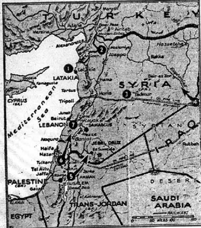
ВІЙНА НА БЛИЗЬКОМУ СХОДІ. — Німці висадили війська в Латакію (1), щоби здержати наступ британців і „вільних французів“. Летнища коло Алеппа (2) і Тал-муру (3) збомбардовано, а альянти почали наступ: з Іраку долиною ріки Евфрату (4), з Аману (5) до Дамаску, а з Іаффи й Назарету (6) до Бейруту.

Бритійці дозволили князеві Аості виїхати з Етіопії до Рима, де він перебуває з родиною по протоколу. Про рефлексії з конвенції нема що писати, новий в Індії в якогося маж-Як звичайно люди бачили себе взаємно до довго і теми у гось подорожного британського них до балачок не стало. Го-генерала.