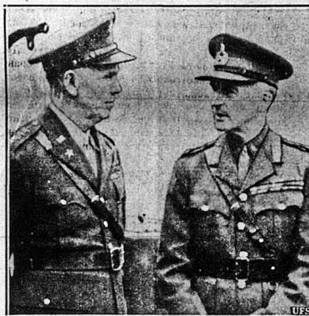
З ІСТОРИЧНОЇ СТРИЧІ. — Підчас історичної стрічі президента Рузвельта й британського прем'єра Чорчила "десь на Атлантику" стрінулися зо собою теж ці два визначні воїни: на ліво, генерал Джордж Маршелл, начальник американського генерального штабу, та генерал сер Джан Г. Дил, начальник британського головного штабу.

"Коли німці окупували даний край, вони захоплюють середники поживи. Опісля вони розділюють поживу між населення, оскільки воно з ними кооперує. В деяких краях нема кооператив і тому пожива, яка є в руках німців, не доходить до населення. "Одначе голодуючі люди вичерпують. По якімсь часі голодуюча особа стається така вичерпана, що вона не може ані любити ані ненавидити свого гнобителя. Вона вже не дбає про ніщо. Є це випадок цілковитого летаргу. Того роду люди не належать до тих, щоб могли повалити своїх панів".