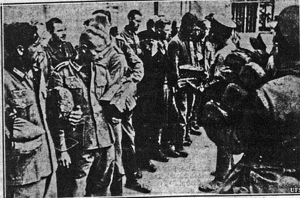
ХЛІБ ВІД ВОРОГА. — І ворог мусить їсти, і ці німці, попавши в російський полон, дістають хліби від своїх переможців. Декотрим з них, видимо, дарунок не зовсім подобається, наприклад, другий жовнір з лівого крила одитий в уніформу летуна. Та він піде до концентраційного табору з іншими й певно привикне. (Російська світлина).

81-83 Grand St., (P. O. Box 346) Jersey City, N. J.