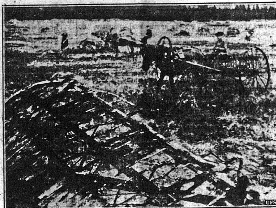
РІЛЬНИЦТВО В ВІЙНУ. — Не дивлячись на німецький „бліцкриг“, селяни советської Росії збирають плоди. На світліні рілничка праця йде на полі, на котрому ще стоять недогарки нацистичного літака.

На західнім фронті британські летуни мусіли обмежити свої нальоти з огляду на погану погоду. Лише малі летунські відділи атакували Дісельдорф і Донкірк.