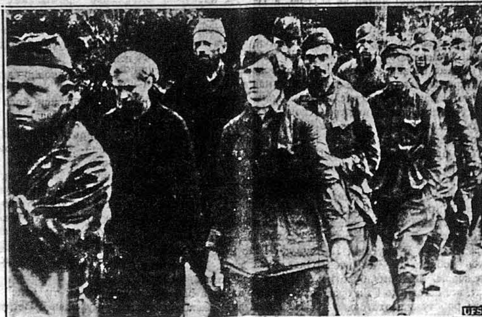
ЖІНКИ БРАНКИ. — Як показує німецька світлина, знята в фінсько-російській війні, між російськими вояками бувають і жінки. Ось на цій світлинці серед вояків, що воювали на північ від Ленінграду, в відділі бранців були дві жінки.

Бритійські бомбовики, в числі 300, налетіли німецькі міста, положені в Баварії, зокрема Ниремберг і тяжко їх бомбардували. При тих операціях вони втратили 24 бомбовики. Німці втратили 22 боевих літаків, які старались зупинити британських летунів.