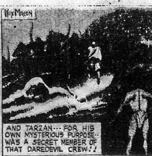
AND TARZAN... FOR HIS OWN MYSTERIOUS PURPOSE... WAS A SECRET MEMBER OF THAT DAREDEVIL CREW!!

Тарзан вискочив на дерево, щоб захопитися перед моряками, які на приказ свого ватажка почали перешукувати околиці.