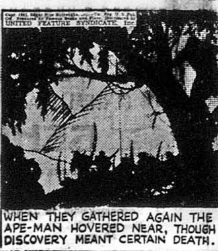
WHEN THEY GATHERED AGAIN THE APE-MAN HOWERED NEAR, THOUGH DISCOVERY MEANT CERTAIN DEATH.