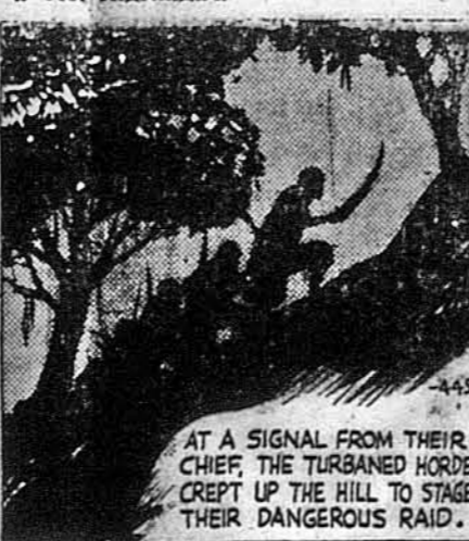
AT A SIGNAL FROM THEIR CHIEF, THE TURBANED HORDE CREEPT UP THE HILL TO STAGE THEIR DANGEROUS RAID.