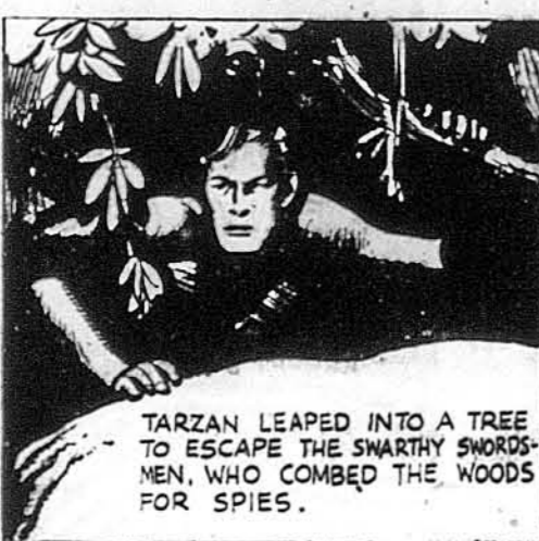
TARZAN LEAPED INTO A TREE TO ESCAPE THE SWARTHY SWORDSMEN, WHO COMBED THE WOODS FOR SPIES.