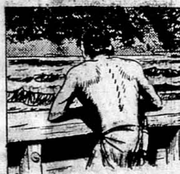
THEN HE'D HIDE IN THE FOREST UNTIL HE COULD MAKE A NEW ATTEMPT TO FREE TOMMY AND ZEELA.