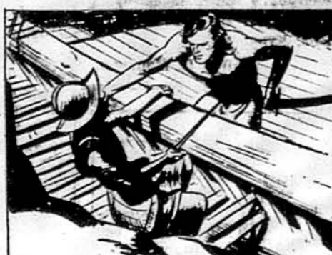
TARZAN REMAINED ABOARD. WHEN THE VESSEL WAS WELL AWAY FROM PALADENE TERRITORY, HE'D SWIM ASHORE.