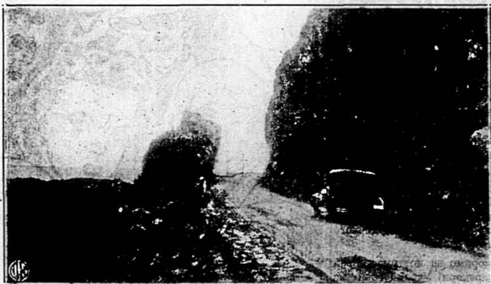
ДЕ ЯПОНЦІ ВИСІЛИ НА БЕРІГ. — Побережжя на острові Люсон, де висіли японські війська. Це є дорога на південь від Віган.

Найбільша черда бобалів знаходиться в Національним Парку, недалеко Едмонтона в Канаді.