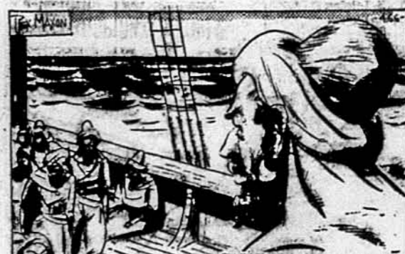
SOON DAWN BROKE AND THE SWARTHY ADK CAPTAIN BRAVELY SURVEYED HIS BATTLE-SCARRED CREW.

Як алакці зазнали цілковитої поразки, вони шукали рятунку на своїй галері. Ту галеру вони скоро відбили від берега.