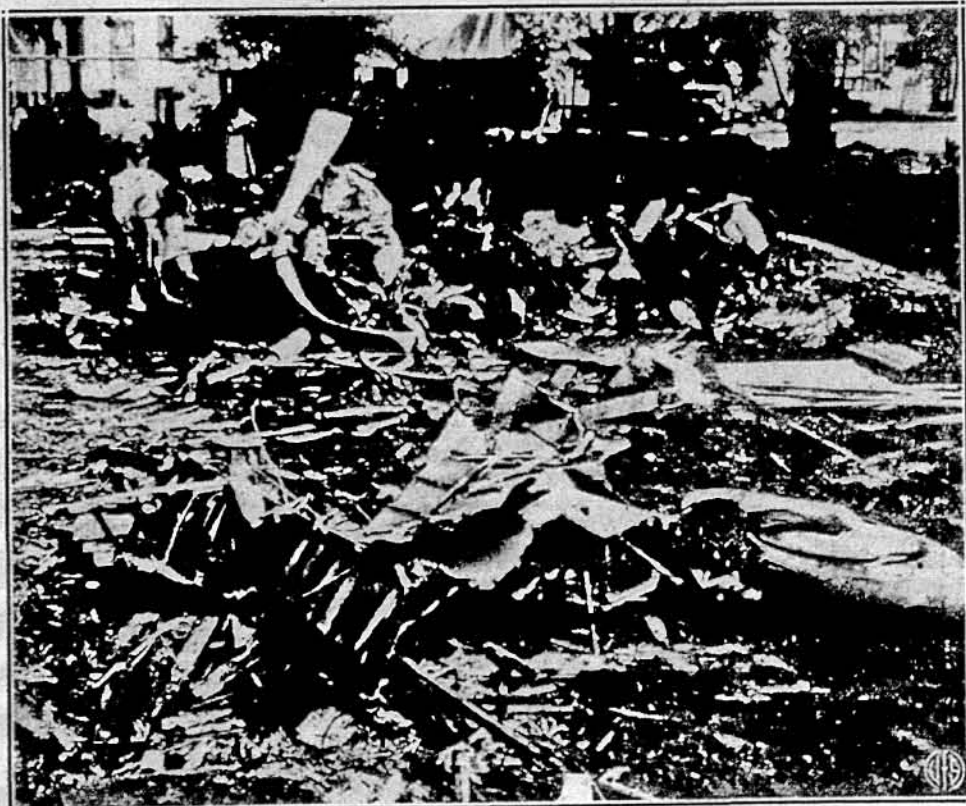
ВОНИ ЗАПЛАТИЛИ ЗА СВОЮ ЗРАДУ. Останки японського літака, зстріленого американськими військами недалеко від летючого майдану Гікема на Гаваї, після зрадницького недільного нападу на острів Злучених Держав. Японці заскочили Перл Гарбор несподівано, але, як лише американці кинулися до бою, вони скоро далися японцям у знаки. Отсей літак упав недалеко від табору „Сі-Сі-Сі“.

УКРАЇНСЬКОГО НАРОДНОГО СОЮЗУ, ЯКИЙ Є НАИБІЛЬШОЮ І НАИСИЛЬНІШОЮ УКРАЇНСЬКО-АМЕРИКАНСЬКОЮ ЗАПОМОГОВОЮ ОРГАНІЗАЦІЄЮ